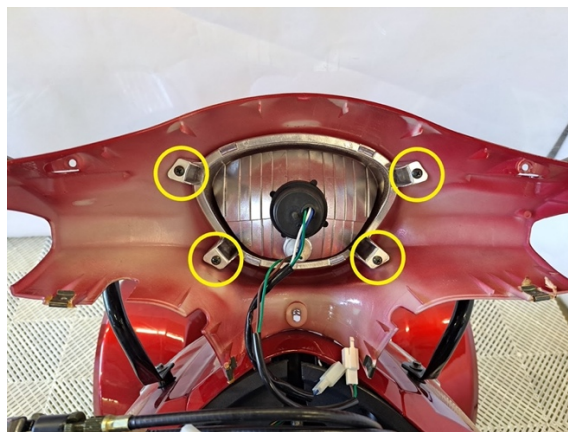
Irrota etuvalon neljä kiinnitysruuvia. (ristipäämeisseli ph2).