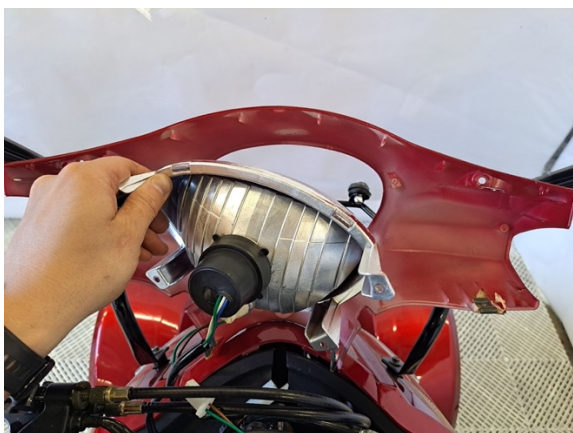
Ota etuvalo pois.

Uuden asennus käänteisessä järjestyksessä.